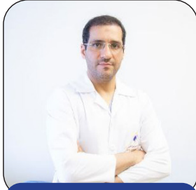
الدكتور مهدي المقتدائي