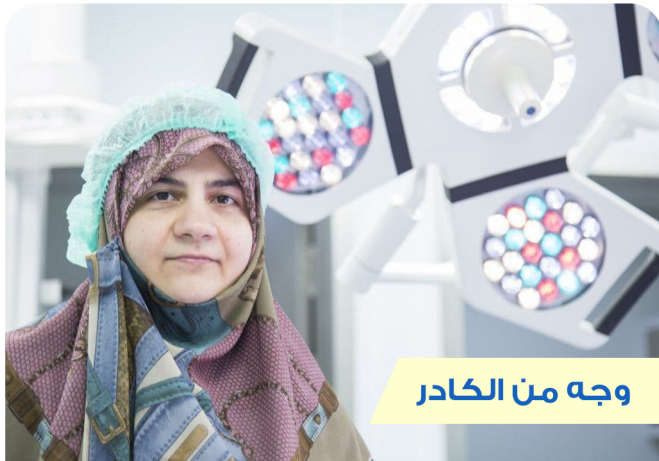
وجه من الكادر