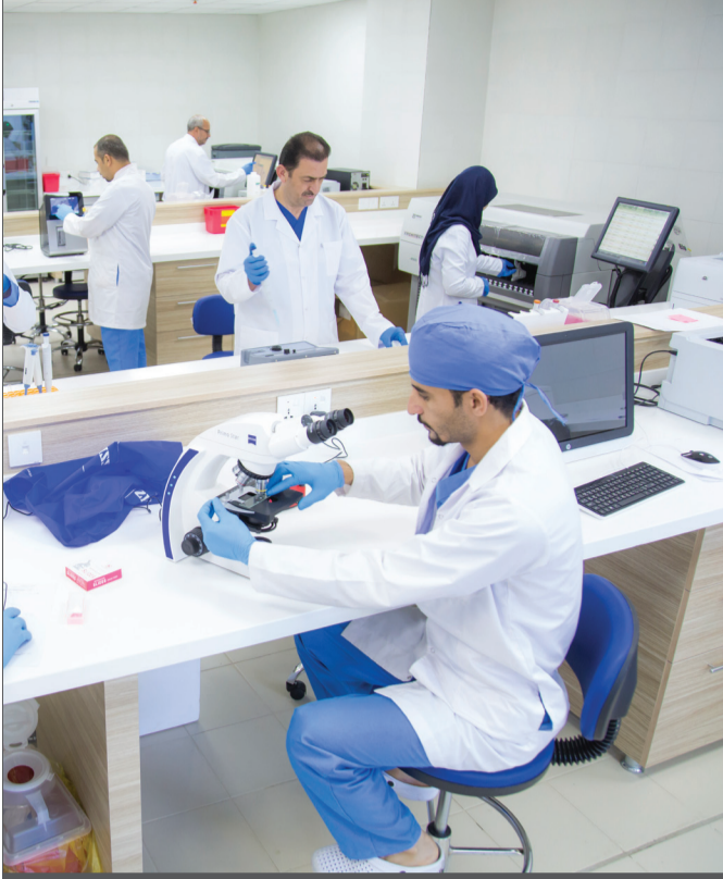
مختبر المستشفى يفتتح يومياً من الساعة ٧:٣٠ صباحاً إلى ١٠:٣٠ مساءً

الغذائية الضارة للجسم . ويجب التقليل من تأثير هذه المواد من خلال الكشف عن وجودها في الجسم والمحافظة على معدلاتها الطبيعية باتباع الحمية الغذائية والمعالجة الصحيحة.